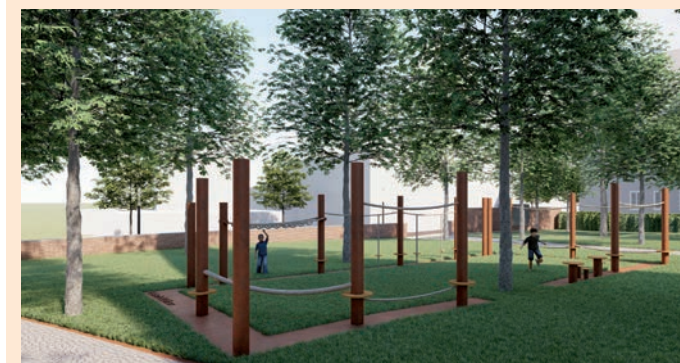
Visualisierung: Landschaftsarchitektur-Planungsbüro Lohaus · Carl · Köhlmos, Hannover

Die Pflasterung zwischen MDM und Kirchplatz ist bereits fertiggestellt, hier lädt ein kleiner zusätzlicher Platz zukünftig zum Verweilen ein. Daran wird sich eine Sitztreppe anschließen. Auch auf dem Kirchplatz wird es einiges zu bestaunen geben: Das Bodenfenster zum Keller der Familie Pins und auf dem Fundament der früheren Lateinschule wird ein Niedrigseilgarten alle kleinen und großen Besucher zum Klettern einladen. Als Erweiterung im Quartier kann der gesamte Kirchplatz zukünftig als Outdoorfläche für Angebote genutzt werden. – wie großartig!