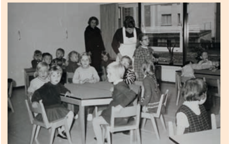
Der Anna-Kindergarten in den 60er Jahren