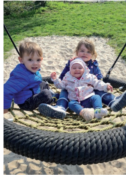
Wir verbringen mit den Kindern viel Zeit in der Natur, besuchen dabei auch die Parks und Spielplätze in der Umgebung.

Das Freispiel ist ein sehr wichtiger Teil unserer Pädagogik. Die Kinder haben an jedem Tag die Möglichkeit, sich eigene Spielbereiche zu suchen, in selbst gewählten Räumen und mit selbst gewählten Spielpartnern und Freunden den Alltag zu gestalten. Dies unterstützen wir, indem wir die Kinder beobachten und Impulse setzen, aber auch Rückzugsmöglichkeiten schaffen, in den die Kinder ungestört spielen können.