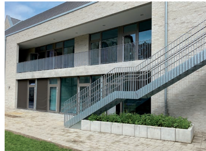
Blick auf und in die Einrichtung.